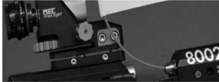
חוט פלסטיק בולט בנשק אוויר

החל מעונת התחרויות תשע"ד (2013-2014), יעשה שימוש בישראל בדגלוני בטיחות, לפי ההוראות של התאחדות הקליעה הבינלאומית. נשק אוויר - חוט פלסטיק צבעוני אשר מושחל לקנה ובולט מ-2 צדדיו באורך של כ-10-15 ס"מ. נשק זעיר/גדול - אביזר התקוע בבית הבליעה וממנו משתלשל דגלון באורך של כ-10-15 ס"מ.